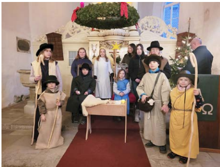
Krippenspiel in Schnellroda und Albersroda