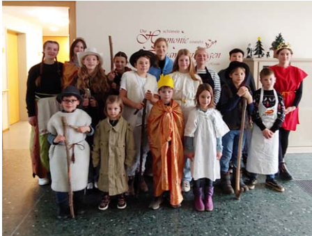
Das Krippenspiel von St. Jakobi wurde am Morgen des Heiligabend bereits im Seniorenzentrum Müheln aufgeführt.