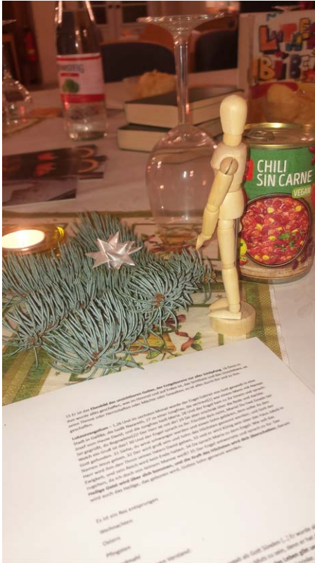
Theologischer Abend

ST. JAKOBI. Einfach eine gute Mischung: nette Getränke, spannende Menschen und kluge Gedanken über Gott, die Bibel und uns. Wir haben das Buch der Bücher durchforstet und nachgelesen, in welcher Körperhaltung die Menschen damals beteten. Zu unserer Überraschung hat kein einziger von ihnen die Hände gefaltet.