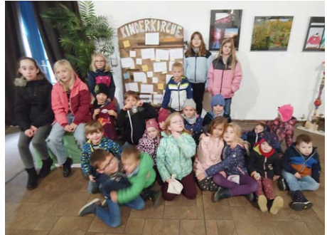
Die Kinder der Kinderkirche vor der mit Thesen beschlagenen Tür, die beim Kulturmonat einen Preis gewann.

ler hörten und weihnachtliche Deko für ihr Zuhause bastelten, gestalteten „die Großen“ wunderschöne Weihnachtskarten für die Partnergemeinde in Holland. Unser eigenhändig geschöpftes Papier vom September versahen wir dazu mit lieben Grüßen und „Finger-Abdruck-Motiven“ und schickten es als Karten ins Nachbarland. Sie haben dort viel Freude bereitet und unsere christliche Verbindung gestärkt.