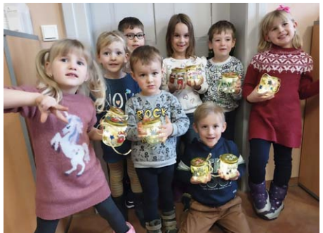
In der Minikirche bastelten wir im Dezember weihnachtliche Dekoration mit Lichtern.