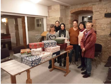
Weihnachten im Schuhkarton in Schnellroda

SCHNELLRODA. Schon am 1. November trafen sich Jung & Alt in der Winterkirche in Schnellroda um 25 Päckchen für bedürftige Kinder zu packen. Gern können Sie auch jetzt schon übers Jahr kleine Schätze für die nächste Aktion sammeln. Herzlichen Dank an alle Beteiligten.