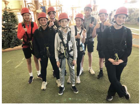
Konfirmanden im Kletterpark Günthersdorf