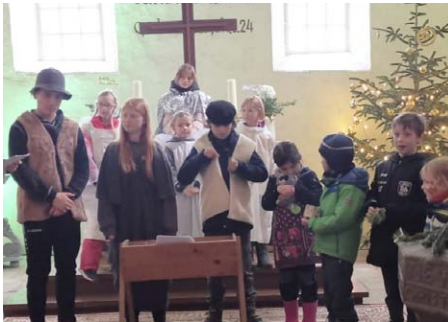
Krippenspiel in St. Micheln