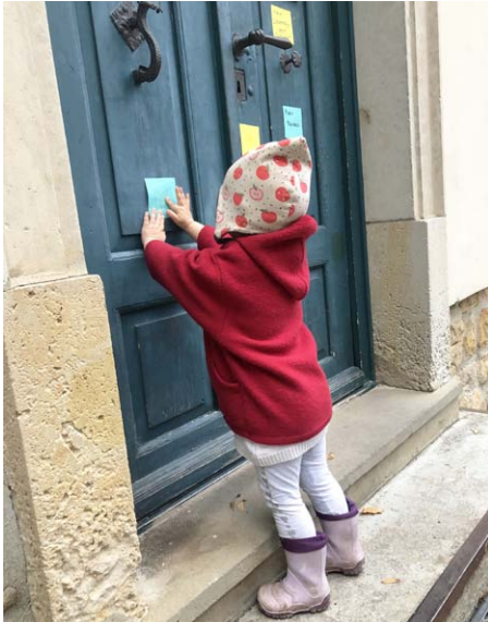
Am Reformationstag klebten wir unsere eigenen Thesen an die Pfarrhaustür in Bad Lauchstädt