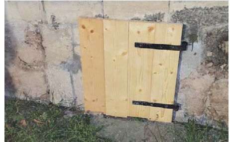
Neue Tür für die Krypta

ST. JAKOBI. Bereits zum Stadtfest hatten Unbekannte die kleine Außentür zur Krypta an der Stadtkirche St. Jakobi zerstört. Da aber nichts weiter gestohlen wurde, kam die Versicherung für den Schaden nicht auf.