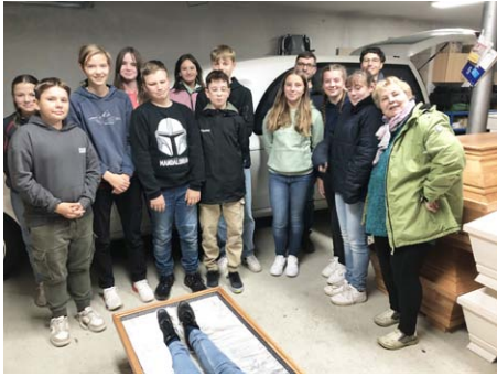
Konfirmanden beim Bestatter Abendfrieden in Bad Lauchstädt