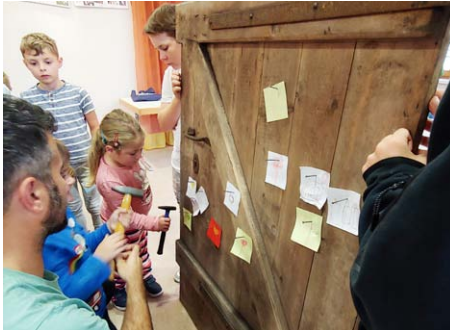
Im Oktober schlugen wir Thesen an eine Tür.

MÜCHELN. Im Oktober durften die Kinder der Kinderkirche aufschreiben oder malen, was ihnen gut oder gar nicht gefällt. Diese „Thesen“ und unsere Friedensbotschaften, die im September während des Buchdruck-Projektes entstanden, nagelten sie dann an eine Tür. Das fertige Ergebnis war Ausstellungsstück beim Müchelner Kulturmonat und gewann sogar einen Nachwuchspreis.