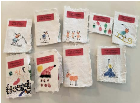
Die Kinder fingerstempelten Weihnachtsmotive auf das geschöpfte Papier.

Während die Kinder der Minikirche im Dezember das Märchen vom Sternenta-