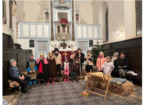
Krippenspiel in Wunsch