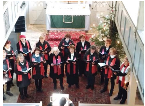
Weihnachtslieder mit Cantamus

OBEREICHSTÄDT. Am dritten Advent füllte der Chor Cantamus aus Obhausen unter der Leitung von Herrn Dalitz die Kirche in Obereichstädt mit deutschen und internationalen weihnachtlichen Klängen.