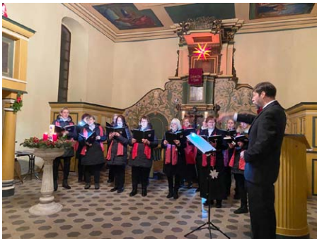
Konzert in der Kirche Schmirma

SCHMIRMA. Gleich das erste Türchen des lebendigen Adventskalenders der Stadt Mücheln öffnete sich in Schmirma, in der bezaubernden Dorfkirche. Dazu war eigens der Chor "Cantamus" aus Obhausen angereist. So konnte nun beides an diesem frühen Adventsabend mit einem gemütlichen Beisammensein ausklingen. Kalender und Konzert. Ein Format, das sich lohnt, es zu wiederholen.