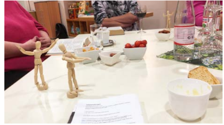
Theologischer Abend zum Thema Gebetshaltungen

ST. JAKOBI. Einfach eine gute Mischung: nette Getränke, spannende Menschen und kluge Gedanken über Gott, die Bibel und uns. Wir haben das Buch der Bücher durchforstet und nachgelesen, in welcher Körperhaltung die Menschen damals beteten. Zu unserer Überraschung hat kein einziger von ihnen die Hände gefaltet.