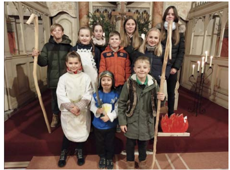
Krippenspiel in Langeneichstädt