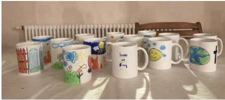
Konfirmanden gestalten ihre eigenen Tassen zum Thema Himmel und Hölle.

Unsere Jugendlichen werden von der Kirchengemeinde auf die Spurensuche nach Gott geschickt. Dabei konnten wir in Bad Lauchstädt im Bestattungshaus Abendfrieden alles, wirklich alles, fragen, was uns zum Thema Tod und Bestattung auf der Seele brannte. Außerdem durfte jeder, der wollte, einmal im Sarg probeliegen.